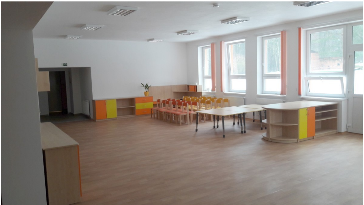
Interiér nové třídy