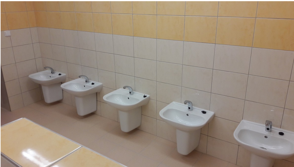
Sociální zařízení u nové třídy