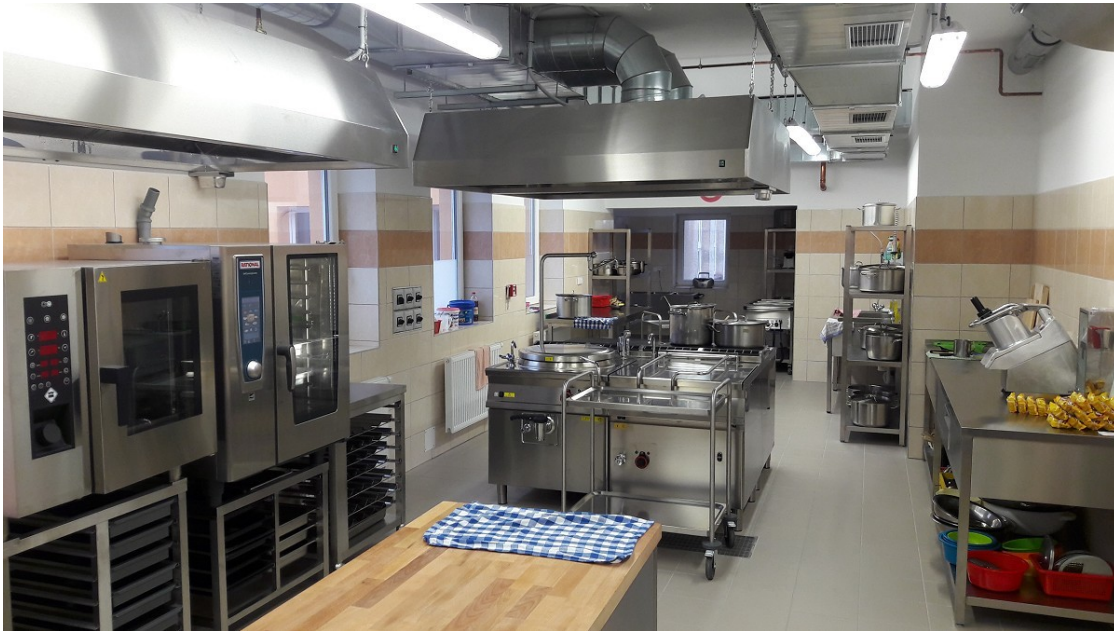
Moderně vybavená kuchyně