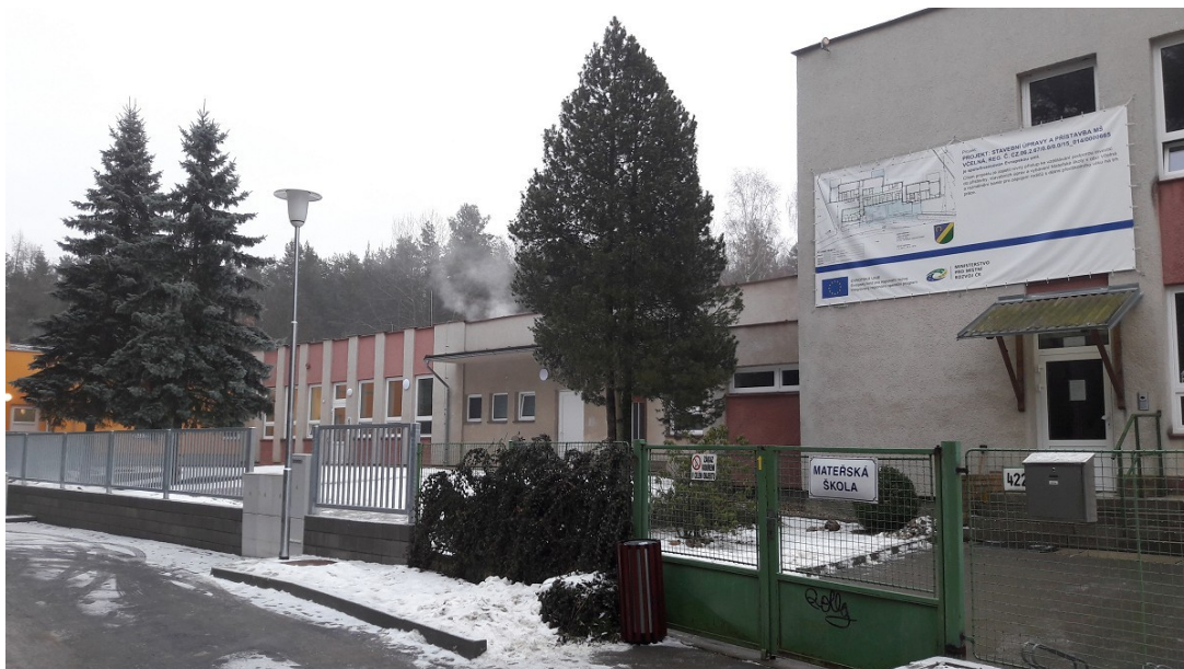
Vlevo nové kovové oplocení s podezdívkou a vpravo billboard s publicitou