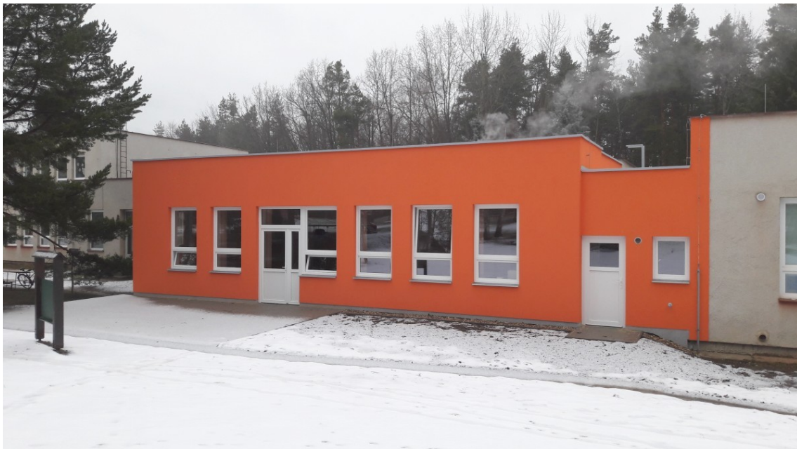
Oranžová fasáda přístavby nové třídy