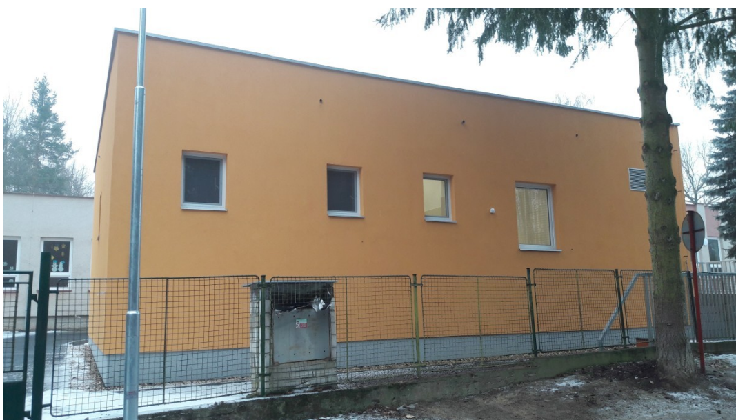
Oranžová budova bývalé kotelny, dnes nová kuchyně