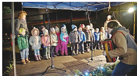
U stromku / Na setkání seniorů