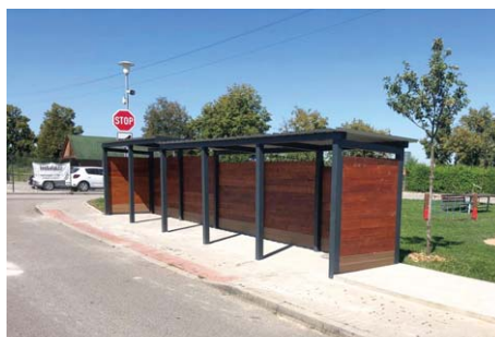
Designové přístřešky na kontejnery se objeví i na dalších stanovištích