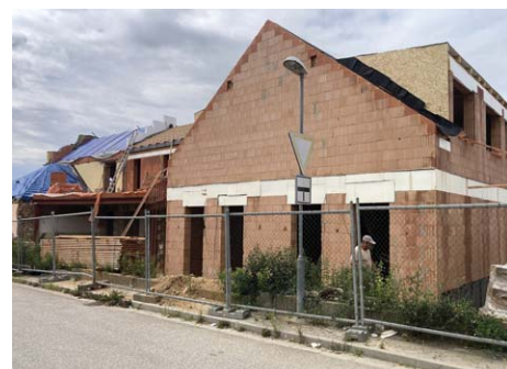
Budoucí tělocvična a podkrovní byty U Petřů