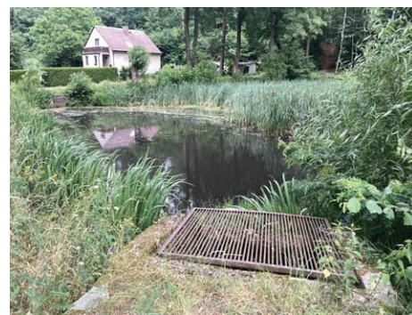
Rybník „bahňák“ potřebuje revitalizaci