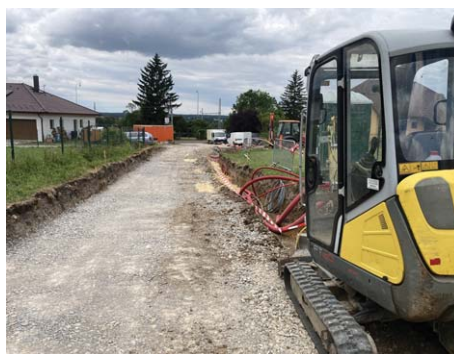
Stavební ruch v ulicích Luční a Witthanova

V polovině června jsme vyhlásili záměr pronájmu nebytových prostor v Kulturním centru Včelná . Jednoduše řešeno, po 3 letech hledáme provozovatele na další období. Rádi bychom kulturní centrum více otevřeli veřejnosti, zejména poté, co se sportovní aktivity a kroužky pro děti přesunou do nově budované tělocvičny v „Domě U Petřů“.