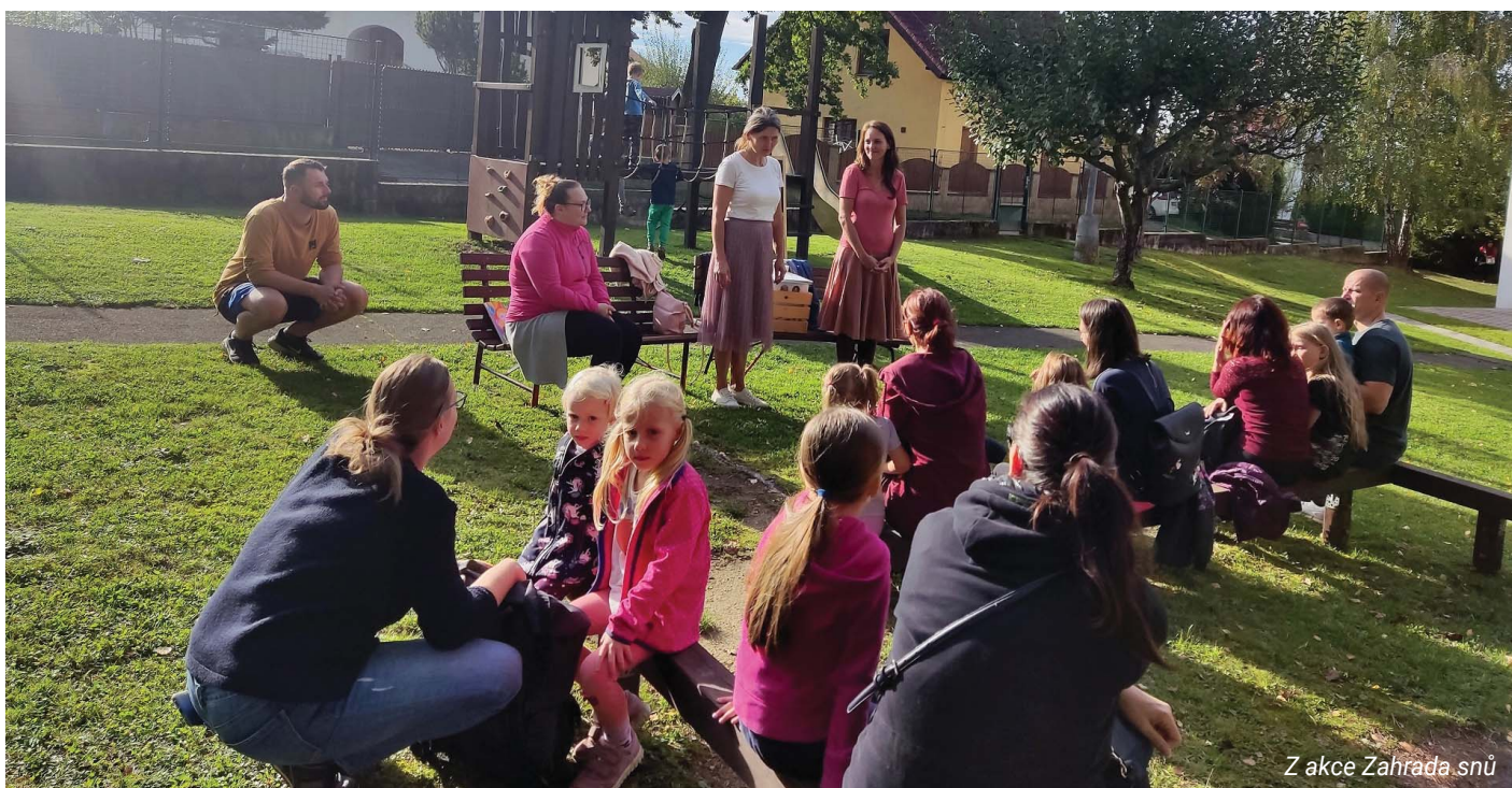
Z akce Zahrada snů