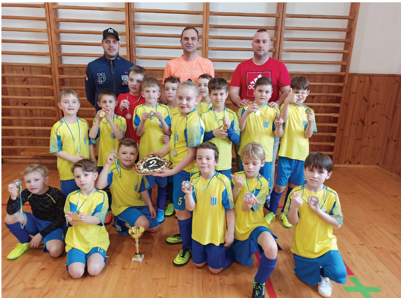
FOTO: mladší přípravka

V sobotu 29. 2. 2020 se naše mladší přípravka zúčastnila halového fotbalového turnaje na Dobré Vodě u Českých Budějovic. Ve slušně obsazeném turnaji jsme ze šesti účastníků obsadili krásné druhé místo s bilancí dvou výher a tří remíz.