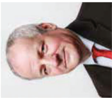
Prof. MUDr. Roman Prymula, CSC., Ph.D. Epidemiolog