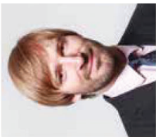
Mgr. et Mgr. Adam Vojtěch, MHA Ministr zdravotnictví