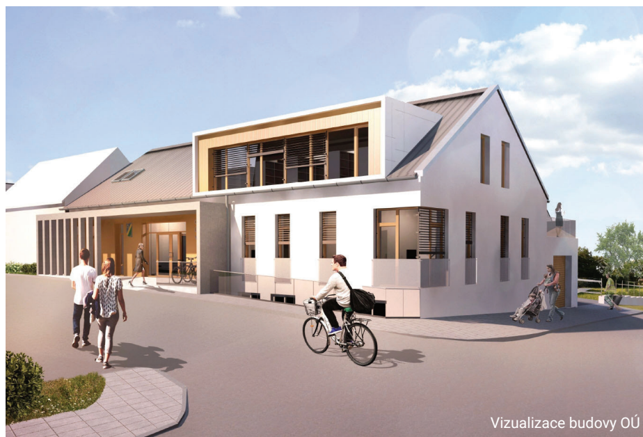
Vizualizace budovy OÚ

S příchodem června se změnila také četnost svozů komunálního a bio odpadu . Nyní se již svážejí popelnice v celé obci každý týden . Zároveň nám byly na obec již dodány kompostéry , které obec pořídila z dotace. Všechny zájemce, kteří se přihlásili, jsme formou SMS zprávy vyzvali, aby si kompostér vyzvedli ve sběrném dvoře za obecním úřadem v Dlouhé ulici. Vydávání probíhá vždy v úterý od 9 do 12 hodin a ve čtvrtek v době od 14 do 17 hodin . Upozorňujeme, že kompostér s veškerým příslušenstvím váží okolo 20 kg! Máme několik kompostérů navíc, pokud byste měli zájem se dodatečně zaregistrovat , prosím ozvěte se na obecní úřad – tel. 387 250 223.