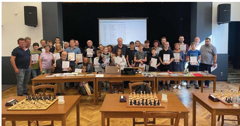
V září se uskutečnil 1. ročník šachového turnaje o pohár starostky obce