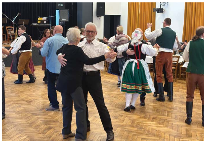
Z listopadového setkání se seniory