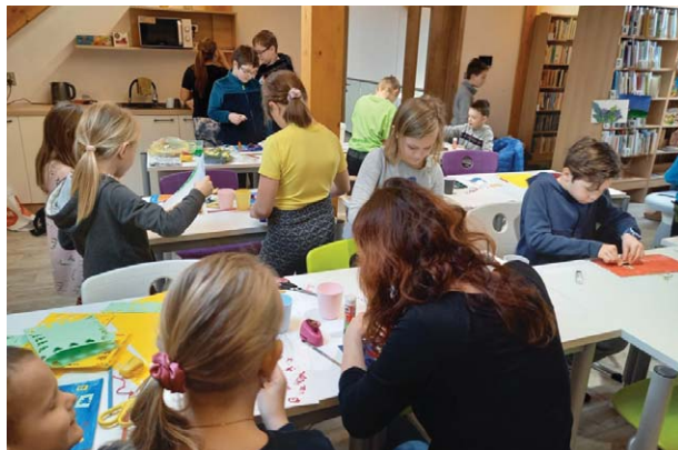
Několik akcí se uskutečnilo v knihovně. Například toto únorové tvoření.