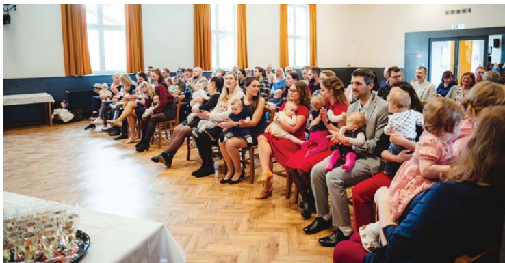
V únoru bylo přivítáno 22 nových občánků