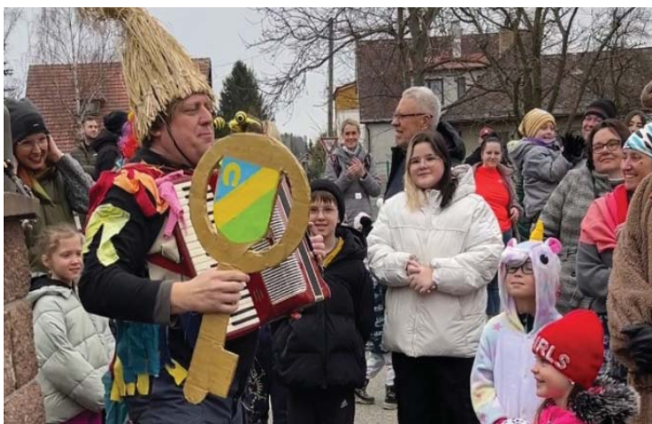
Z únorového masopustu