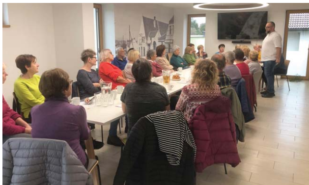
Jedna ze série přednášek pořádaných ICOS Český Krumlov, o.p.s. – prosincové vánoční pečení