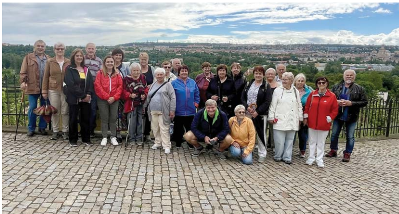
Květnový výlet do botanické zahrady v Praze