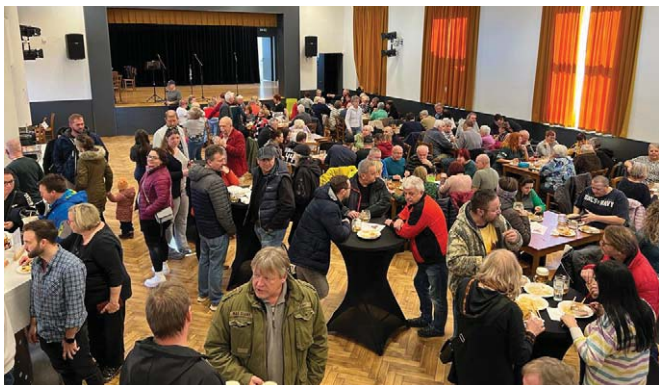
Lednové vepřové hody v Kulturním centru